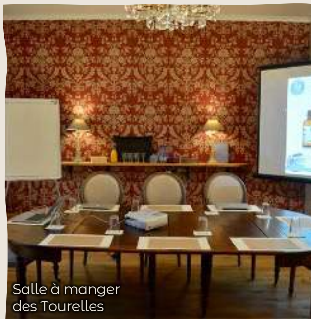
Salle à manger des Tourelles