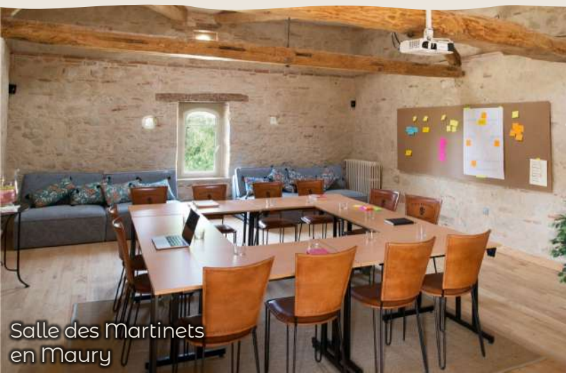
Salle des Martinets en Maury