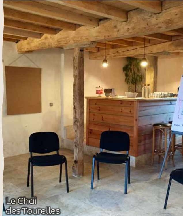
Le Chai des Tourelles