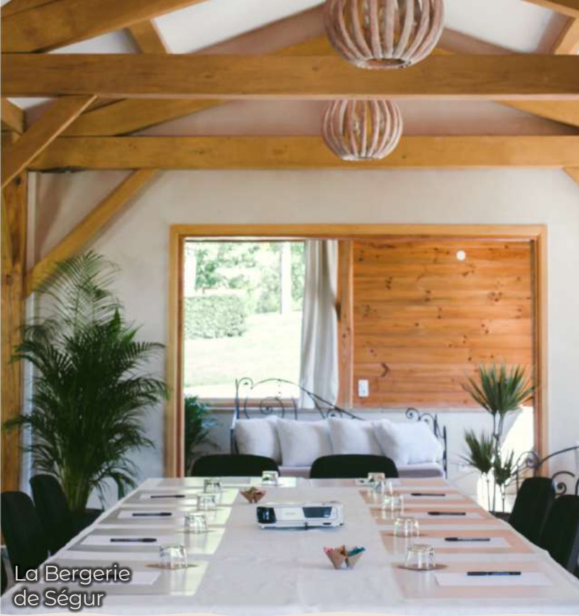
La Bergerie de Ségur